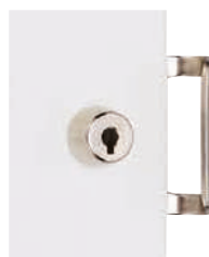
Standard : Poignée de tirage intérieure chromée