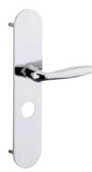
Béquille sur plaque brillante Modèle Vérona