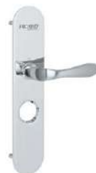
Béquille sur plaque effet brossé Modèle Génova