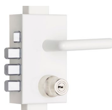
Standard : Béquille blanche