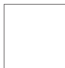
Blanc RAL 9010