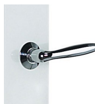
Béquille avec rosace chromée