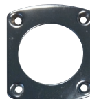
Rosace en inox